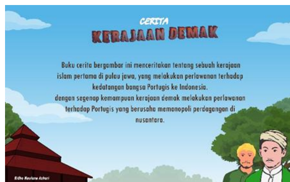
Gambar 6 Sampul Belakang

Desain sampul buku yang telah melewati proses pewarnaan ini diharapkan dapat disukai dan menjadi solusi permasalahan bagi para pembacanya yang sebagian besar merupakan anak-anak. Sampul buku ini juga merupakan representasi dari isi dari buku cerita bergambar sejarah Kerajaan Demak. Karena tokoh yang ada pada sampul ini Raden Patah dan Adipati Unus yang sering terlihat pada media buku cerita bergambar. Warna yang dipilih pada desain sampul ini kebanyakan warna-warna cerah yang disukai oleh anak-anak.