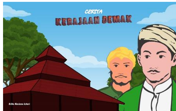
Gambar 5 Sampul Depan