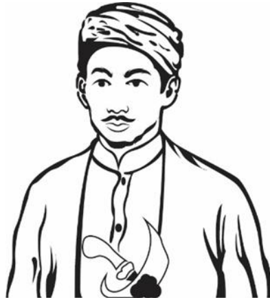
Gambar 3 Sketsa Karakter Raden Fattah

Kemudian pembuatan sketsa gambar dari tokoh pendiri Kerajaan Demak, yaitu Raden Patah.