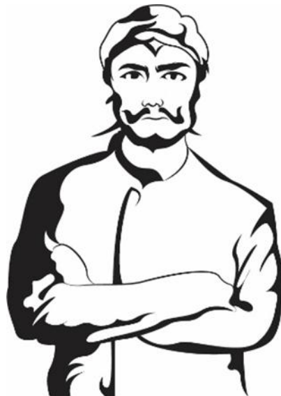
Gambar 2 Sketsa Karakter Adipati Unus

Selanjutnya adalah sketsa digital gambar tokoh kerajaan demak, yaitu Adipati unus.