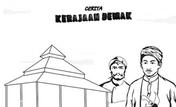
Gambar 4 Sketsa sampul

Proses Selanjutnya adalah sketsa sampul hasil dari penggabungan sketsa tokoh Adipati Unus, Raden Patah, dan sketsa Kerajaan Demak.