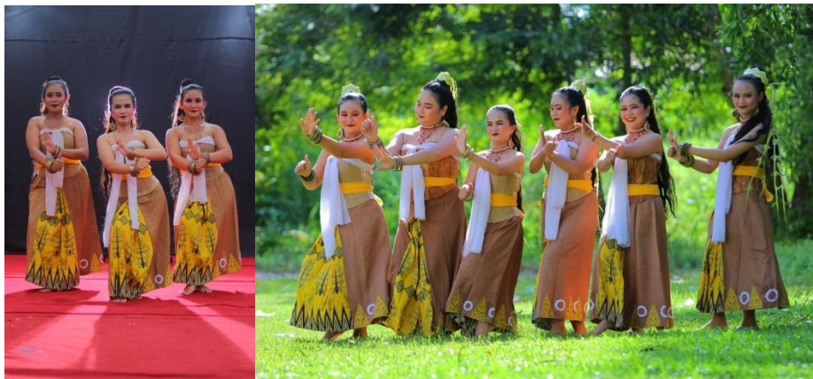
Gambar 6. Tata Rias dan Busana Tari Miempu