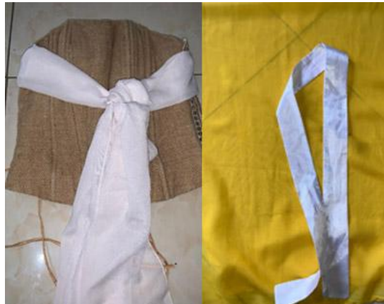
Gambar 5. Gambar Kemben dan Ikat Kepala