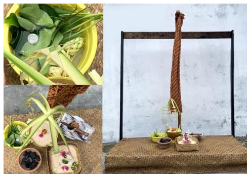
Gambar 2. Gambar Properti Ritual

Properti dalam pertunjukan tari Miempu menunjukkan tingkat kompleksitas tinggi karena berasal dari ritual tradisional yang mengandung makna simbolis mendalam. Pertunjukan ini melibatkan berbagai jenis properti, antara lain Mansi Junyung , terdiri atas lilin, cermin, rawen kamat , tanringit rawen kapas , dan weah . Selain itu, digunakan pula Na'nahh berupa beras, serta Gantang , berupa tiga susun bakul rotan, giling pinang , dan tanringit . Properti tambahan mencakup Piring Pasiwahan , terdiri atas empat jenis piring khusus untuk prosesi pasiwahan, disertai bahan-bahan ritual seperti beras, arang, kunyit, bahalain (selendang), dan lading atau besi. Unsur penting lainnya yaitu Iwai , mencakup bahalai dan tatungkal , serta Ansak , meliputi uang logam, dedaunan, air, dan anyaman daun kelapa. Seluruh elemen tersebut disusun secara terstruktur dan ditempatkan pada area khusus sebagai pusat pelaksanaan ritual penyembuhan, disebut ampatung .