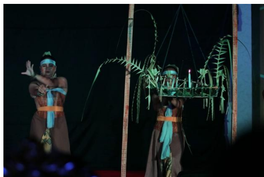
Gambar 3. Penggunaan Properti saat Pementasan