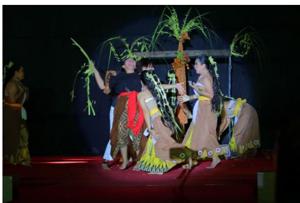
Gambar 4. Pementasan Tari Miempu

tari merupakan pokok permasalahan yang mengandung makna tertentu dalam sebuah koreografi, baik bersifat literal maupun non-literal. Dengan demikian, tema tari dapat dipahami sebagai dasar pemikiran atau pesan utama diungkapkan melalui pertunjukan tari. Tema ini bisa berupa narasi konkret atau konsep, disampaikan secara langsung (literal), maupun makna simbolik bersifat interpretatif dan lebih mendalam (non-literal). Dalam proses penciptaan tari, tema menjadi fondasi penting dalam membangun struktur koreografi, menentukan ragam gerak, dan menciptakan atmosfer sesuai pesan yang ingin disampaikan (Hadi, 2016). Tari Miempu mengangkat tema literal, bersumber dari ritual adat masyarakat Suku Dayak Ma'anyan di Desa Dorong, Kabupaten Barito Timur, Kalimantan Tengah. Sementara itu, tema non-literal dalam tari ini diwujudkan melalui penggambaran kondisi masyarakat yang mengalami penyakit dan memerlukan ritual Miempu sebagai upaya penyembuhan.