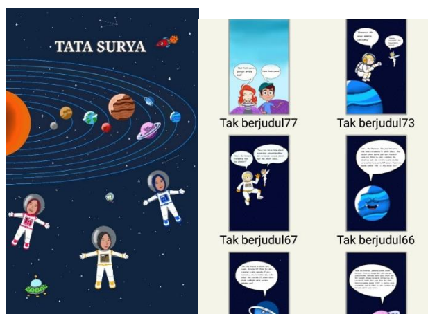
Gambar 2. Tampilan Beberapa Isi Komik Digital

Berdasarkan hasil validasi dari ahli materi, media dan bahasa maka diperoleh rata-rata validator sebesar 88,98%. Hal tersebut menunjukkan bahwa komik digital yang dikembangkan valid dan dapat dikatakan layak untuk digunakan. Setelah produk media diperbaiki sesuai saran dan masukan para validator, maka komik digital yang dapat digunakan. Berikut tampilan dari Komik Digital.