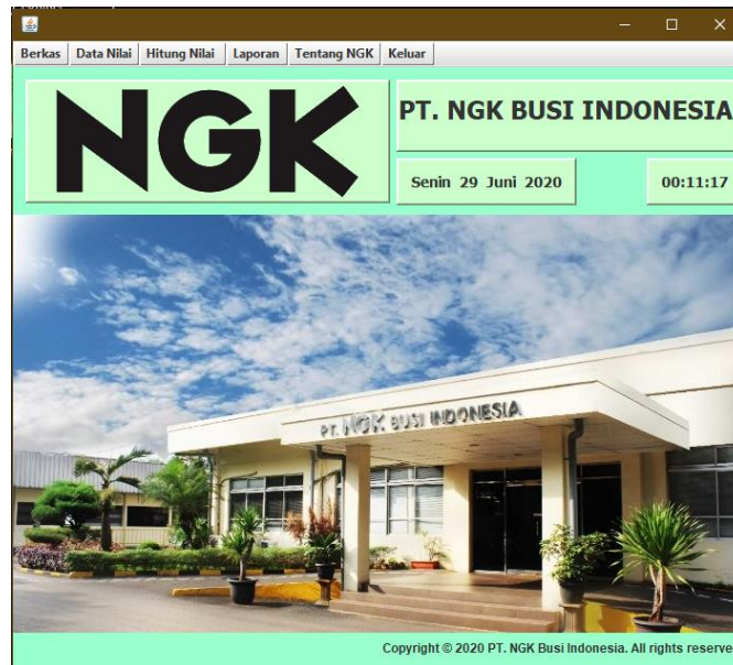
Gambar 2. Tampilan Layar Menu Utama

Berikut ini hasil Perancangan Sistem Pendukung Keputusan Pemilihan Karyawan Terbaik