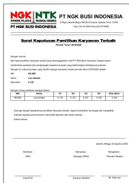
Gambar 3. Tampilan Surat Keputusan Pemilihan Karyawan Terbaik