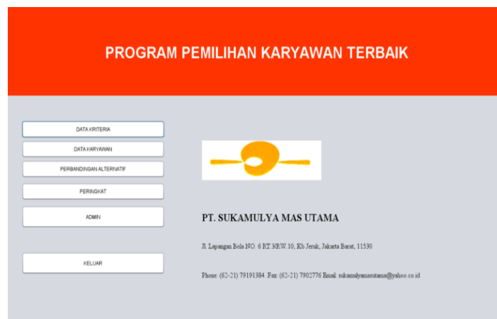
Gambar 3. Tampilan Layar Menu Utama

Di halaman Login ini, terdapat dua kolom teks yang harus diisi oleh admin agar bisa masuk ke dalam aplikasi