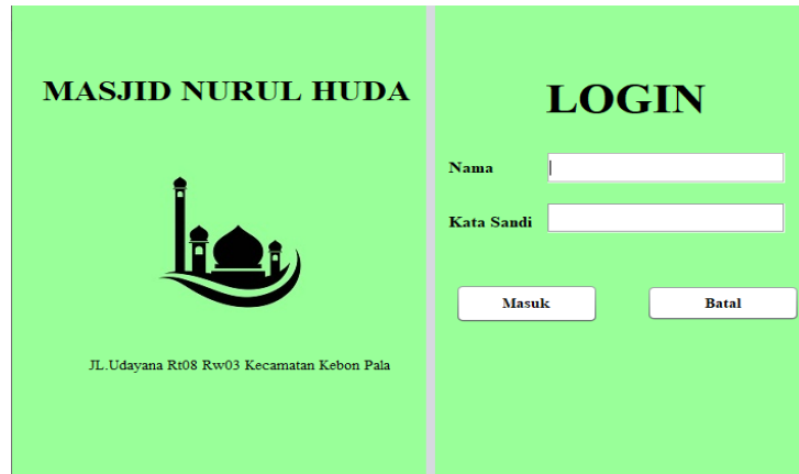
Gambar 4. Tampilan Login

Tampilan layar login ini dirancang untuk memberikan akses yang aman bagi admin ke dalam sistem setelah mereka berhasil memasukkan nama pengguna dan kata sandi yang benar. Sistem ini memastikan bahwa hanya pengguna dengan kredensial yang valid yang dapat mengakses dan menjalankan program, menjaga keamanan data dan mencegah akses yang tidak sah. Proses autentikasi ini penting untuk melindungi integritas sistem dan memastikan bahwa hanya pihak yang berwenang yang dapat melakukan perubahan atau pengelolaan data.