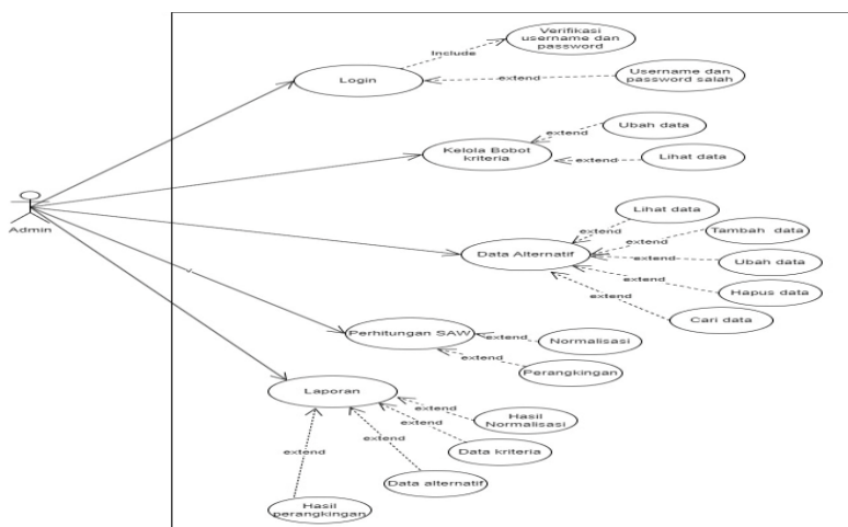
Gambar 1. Use Case Diagram

Use case Diagram merupakan diagram yang menunjukkan hubungan actor dengan proses/aktivitas yang terjadi pada sistem yang dibangun yaitu sistem pendukung keputusan dengan mengimplementasikan algoritma SAW .