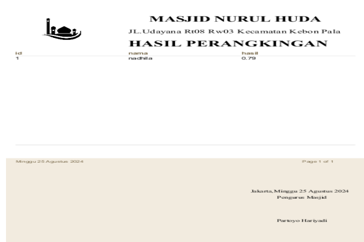
Gambar 6. Tampilan Laporan Peringkat

Laporan ini dapat menampilkan peringkat akhir dari setiap alternatif, memungkinkan pengguna untuk melihat alternatif mana yang paling memenuhi kriteria yang ditetapkan dengan jelas dan transparan. Proses kalkulasi yang dilakukan mencakup analisis mendalam terhadap berbagai variabel dan faktor yang mempengaruhi penilaian, sehingga setiap keputusan yang diambil berdasarkan laporan ini didukung oleh data yang valid dan terukur. Dengan fitur ini, pengguna tidak hanya dapat mengidentifikasi alternatif terbaik, tetapi juga memahami alasan di balik peringkat tersebut, yang penting untuk pengambilan keputusan yang lebih tepat dan bertanggung jawab.