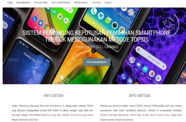
Gambar 2. Tampilan Layar Menu Utama

Tampilan di atas merupakan tampilan layar menu utama. Pada form ini admin dapat mengelola perekomendasi, data kriteria, data smartphone , dan perhitungan.