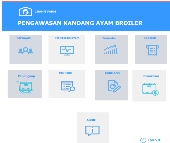
Gambar 5. Tampilan layar menu utama